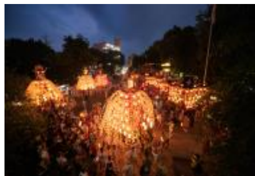
7月19日秩父神社境内の様子