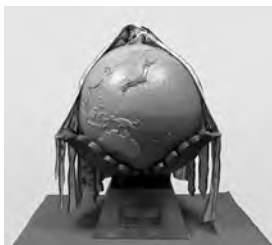
木製地球儀 (高さ60cm、幅50cm、 重さ14.7kg)