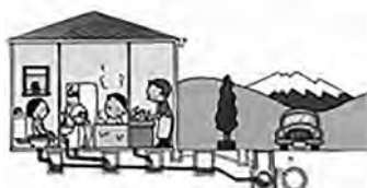
(公社)日本下水道協会イラスト集より