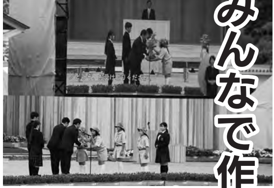
緑の少年団から、農林水産大臣、環境大臣政務官へ苗木が贈呈されました。