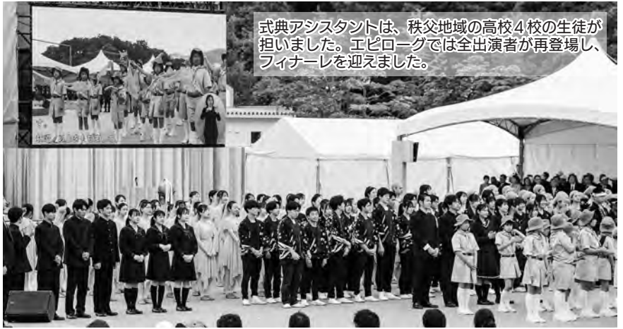
式典アシスタントは、秩父地域の高校4校の生徒が担いました。エピソードでは全出演者が再登場し、フィナーレを迎えました。