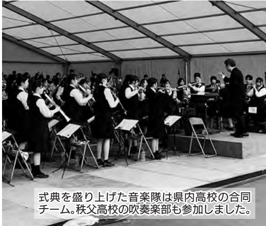
式典を盛り上げた音楽隊は県内高校の合同チーム。秩父高校の吹奏楽部も参加しました。