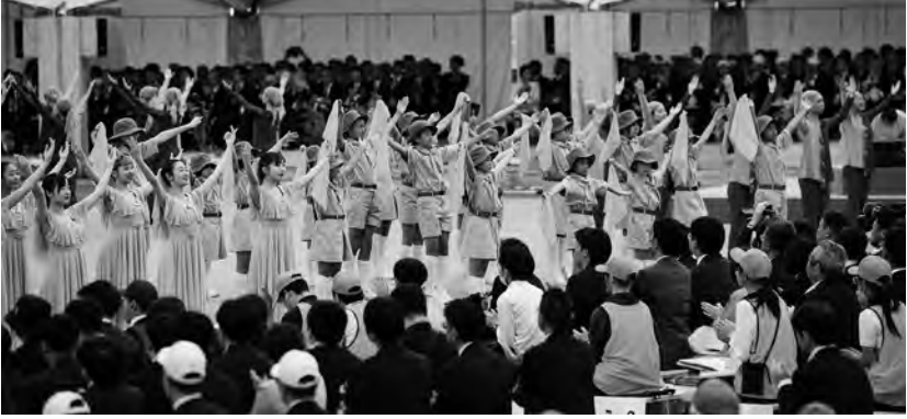
大会テーマの表現では、プロ出演者や高校ダンス部、バレエ団体とともに緑の少年団も出演。