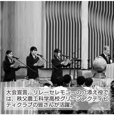
大会宣言、リレーセレモニーの介添え役では、秩父農工科学高校グリーンアクティビティクラブの皆さんが活躍。