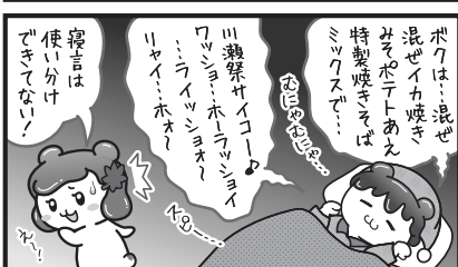
秩父神社の夏祭り「川瀬祭」は毎年7月19日、20日!